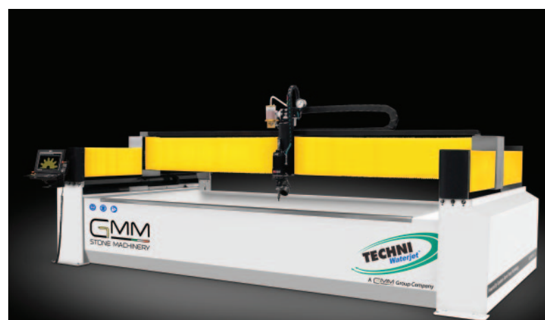
// WATERJET I713

The great versatility of GMM machines has allowed Luismar to open up to various fields of activity both for interior and exterior design. Since they met, GMM and Luismar have shared the same values and the same ambition, two perfect partners for continuous growth.